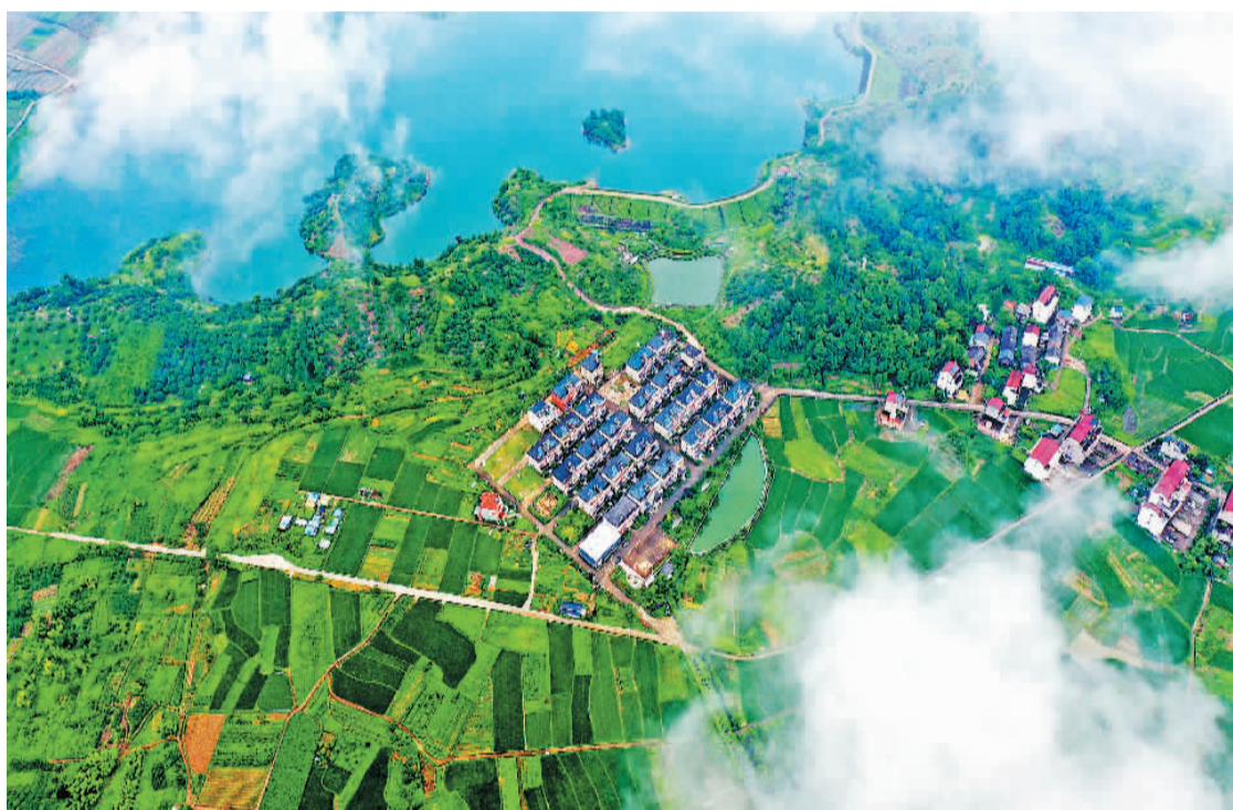
浙江省台州市仙居县福应街道岭东村新联自然村依托丰富的生态山水田园风光，积极发展以乡村旅游为重点的民宿经济、水果种植采摘、休闲垂钓等产业链，助推农民增收。