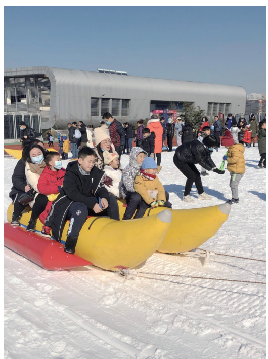
【體育冰雪游為越來越多青島市民所喜愛。】