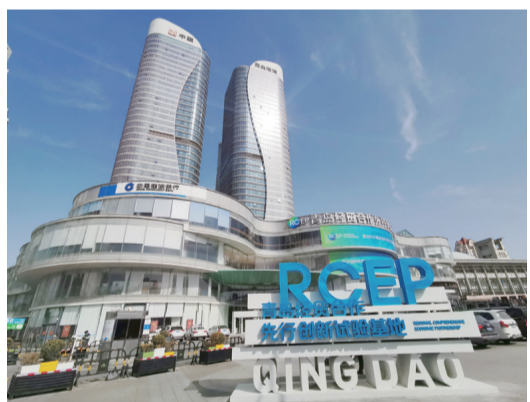
【位于青島郵輪母港城的RCEP青島經貿合作先行創新試驗基地。】

11月5日,在第四屆中國國際進口博覽會舉辦期間,青島市金融貿易航運暨上合示範區合作推介會在上海舉行,來自上海的世界500強、跨國公司、行業領軍企業及金融貿易航運代表企業負責人相聚黃浦江畔,共話合作、共謀發展。