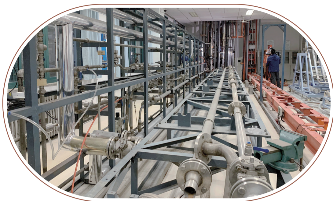
【中國石油大學(華東)孫寶江團隊主持完成的“海洋深水鑽探井控關鍵技術與裝備”項目,在世界深水油氣田得到廣泛應用。】

2020年度中國科學技術獎日前揭曉。青島共有12個項目獲獎,其中技術發明獎2項,科學技術進步獎10項。