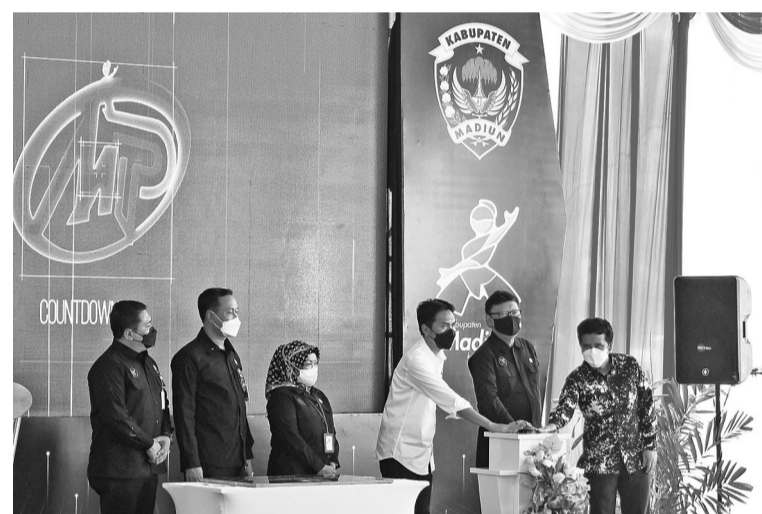
茉莉芬县公共服务大商场开幕

下历史新高或达到了57.2。制造业的出口业绩也极佳或达1311亿盾,或占去年全国出口值的80.3%,这一成就也说明了生产方面也已从初级产品转向具有附加值的制成品。此外,政府也非常关注矿业下游化产品,因此在全国各地建造了各种的冶炼厂,比方说能出产1230万吨的镍矿的冶炼厂,600万吨铝矿的冶炼厂和320万吨铜矿的冶炼厂等。