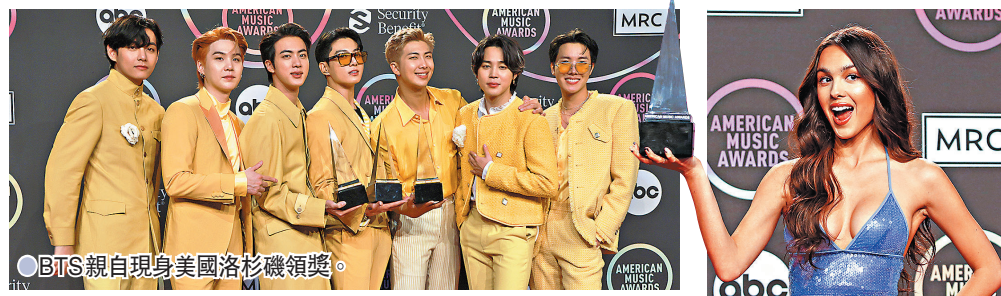
BTS親自現身美國洛杉磯頒獎禮。

香港文匯報訊 據中央社綜合外電報道，全美音樂獎 (American Music Awards) 頒獎典禮在當地時間21日在洛杉磯舉行，主持人是美國饒舌歌手Cardi B。韓國男團BTS (防彈少年團) 入圍3項全獲獎，包括最受歡迎流行組合、最受歡迎流行歌曲，以及壓軸大獎——年度藝人。