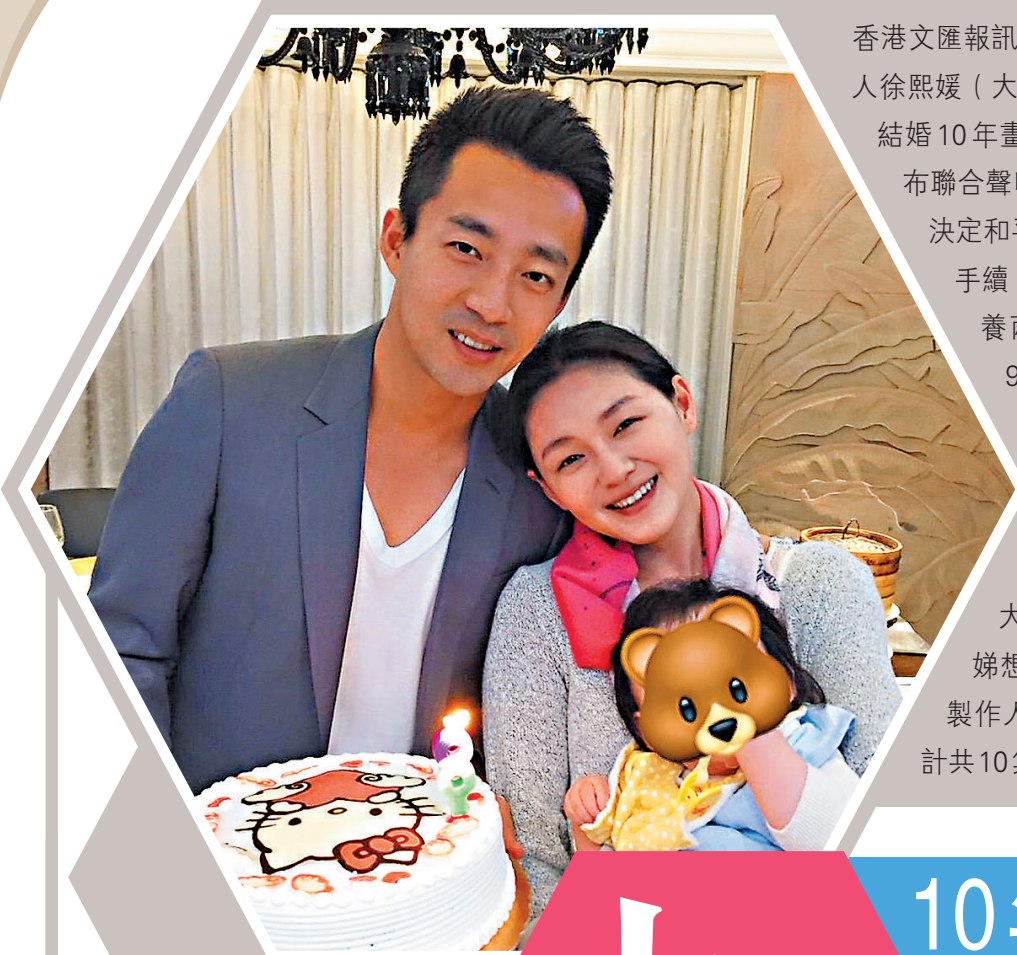
大S和汪小菲離婚後仍共同撫養孩子。