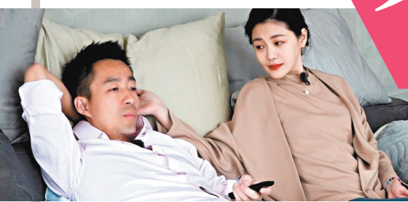
大S與汪小菲曾亮相實境節目《幸福三重奏》。