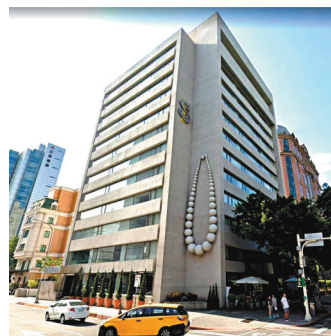
汪小菲以愛妻命名的S Hotel未知將來會否改名。

2010年大S在安以軒的北京生日宴會上和汪小菲相識，當時大S因台劇《流星花園》演女主角「杉菜」爆紅，兩人一見鍾情。大S曾在節目中說，之所以被汪小菲吸引是這個人說話很好笑，和他在一起很放鬆，當年大S和汪小菲僅見面4次、交往20天就閃電結婚，於2011年舉辦婚禮，婚後並育有1子1女。