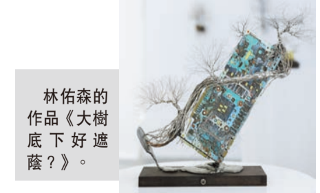
林佑森的作品《大樹底下好遮蔭？》。