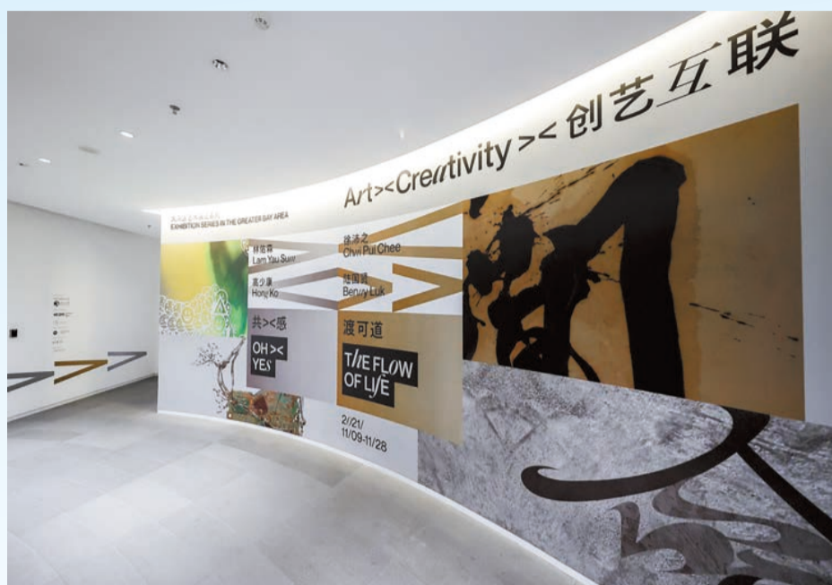
「共><感」及「渡可道」藝術雙展覽由即日起至11月28日假佛山和美術館展出多組藝術作品。

【香港商報訊】由康樂及文化事務署（康文署）轄下藝術推廣辦事處與香港設計師協會共同籌劃的大灣區藝術展覽系列「創><藝互聯」第四及第五個展覽——「共><感」及「渡可道」，由即日起至11月28日在佛山和美術館舉行。四位香港藝術家及設計師從動畫與電影中擷取靈感，創作了多組作品，呈現創作者對生活和人生的感悟。