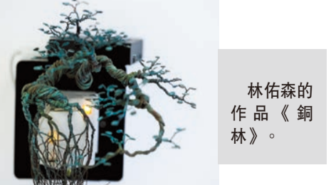
林佑森的作品《銅林》。