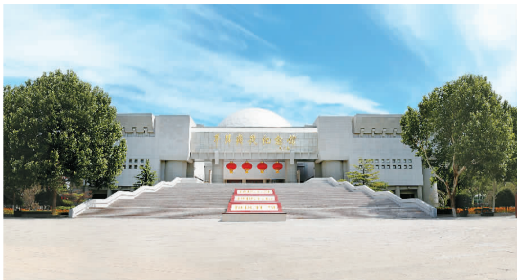
平津战役纪念馆外观。