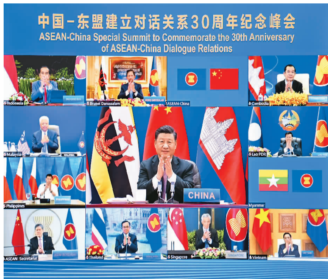
11月22日上午,国家主席习近平在北京以视频方式出席并主持中国—东盟建立对话关系30周年纪念峰会,发表题为《命运与共 共建家园》的重要讲话。中国东盟正式宣布建立中国东盟全面战略伙伴关系。

新华社北京11月22日电 (记者杨依军) 国家主席习近平22日上午在北京以视频方式出席并主持中国—东盟建立对话关系30周年纪念峰会。中国东盟正式宣布建立中国东盟全面战略伙伴关系。