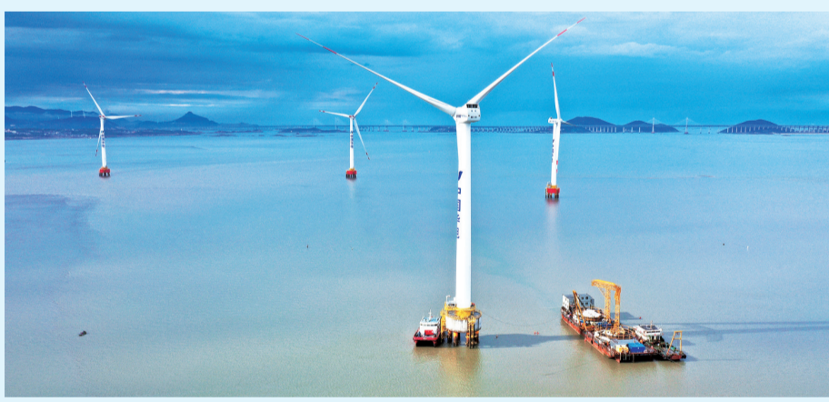
福清海坛海峡海上风电场。

福清海坛海峡海上风电项目是华电集团首个海上风电项目,也是福建省首批核准的6个海上风电项目之一。项目总装机容量近300兆瓦,建成后每年可向福建省提供清洁电能约11.3亿千瓦时,年利用小时3679小时,每年可节约标准煤31.92万吨,减少二氧化碳排放93.91万吨,为福建省实现碳达峰、碳中和目标提供强有力支撑。(朱丹华)