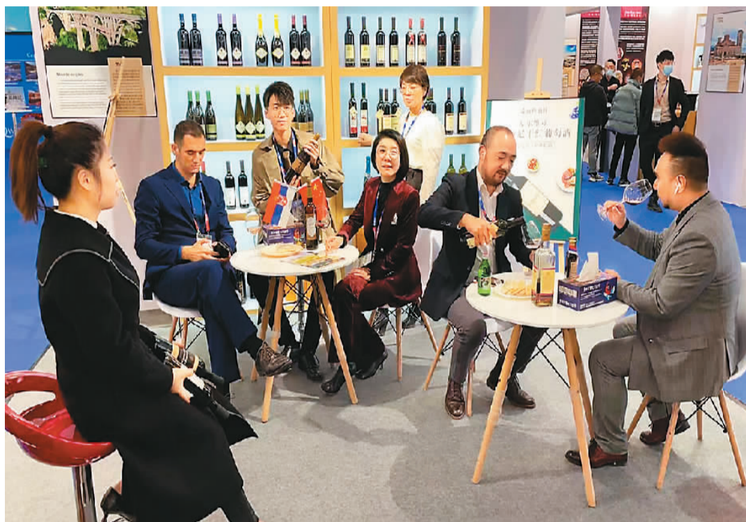
在青田侨博会塞尔维亚·黑山馆展区，参观者在品尝红酒。

作为浙江承接中国国际进口博览会溢出效应的十大平台之一，青田侨博会已连续4年成功举办。从最初的进口葡萄酒，到如今的进口咖啡、火腿、美妆、家居、萌宠等生活类商品，越来越多“时尚新宠”在侨博会亮相。青田借助深厚的侨界力量，正为打造进口商品“世界超市”搭建大舞台。