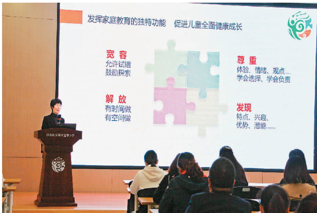
10月20日，在山东省济南市天桥区的宝华小学家长学校，老师为家长进行家庭教育指导。