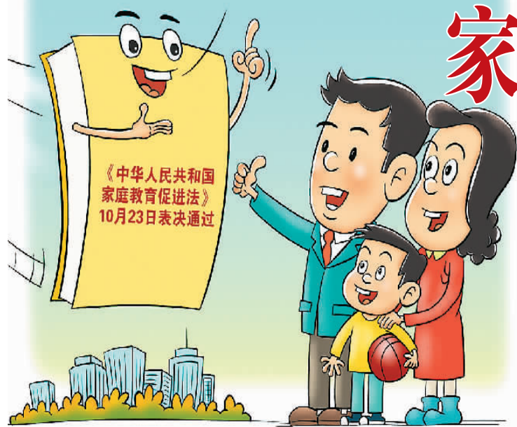
王 琪作

父母“承担对未成年人实施家庭教育的主体责任”“应当合理安排未成年人学习、休息、娱乐和体育锻炼的时间，避免加重未成年人学习负担，预防未成年人沉迷网络”“不得因性别、身体状况、智力等歧视未成年人，不得实施家庭暴力”……日前，中国首部家庭教育立法——《中华人民共和国家庭教育促进法》（以下简称“家庭教育促进法”）颁布并将于2022年1月1日起施行，引发广大家长关注。