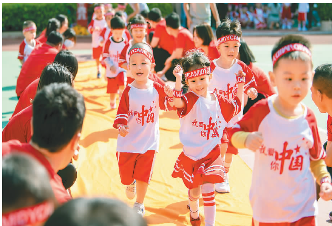
11月13日，在海南省海口市跨世纪成幼儿园秋季亲子运动会上，家长和孩子们一起体验运动带来的快乐，加深了彼此间的情感交流。