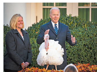
●拜登(右)主持感恩節特赦火雞儀式。