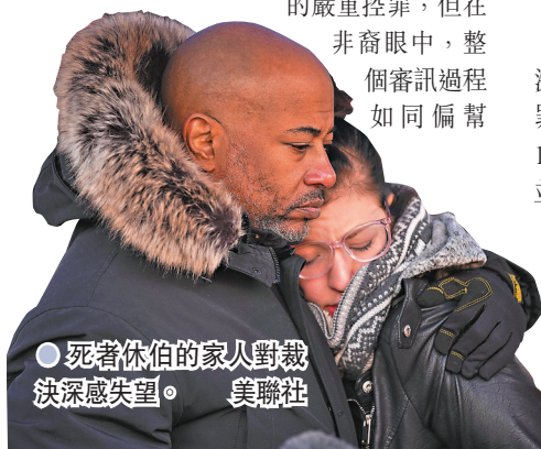
●死者休伯的家人對裁決深感失望。

雖然控方向里滕豪斯提出可判處終身監禁的嚴重控罪，但在非裔眼中，整個審訊過程如同偏幫