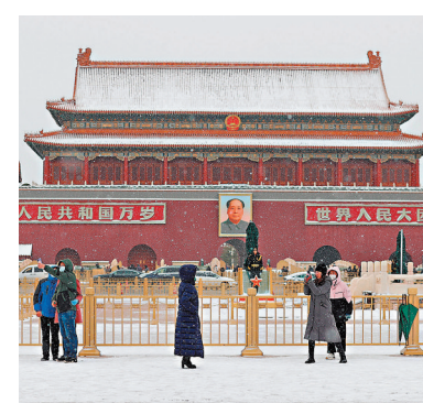
●遊客11月初冒雪遊覽天安門廣場。 資料圖片

香港文匯報訊（記者 劉凝哲 北京報道）北京市人民政府天安門地區管理委員會19日發布通告稱，為營造良好參觀環境和遊覽秩序，結合常態化疫情防控形勢，北京天安門廣場從12月15日起將實施預約參觀措施，散客和旅遊團均需提前預約方可進入廣場區域。