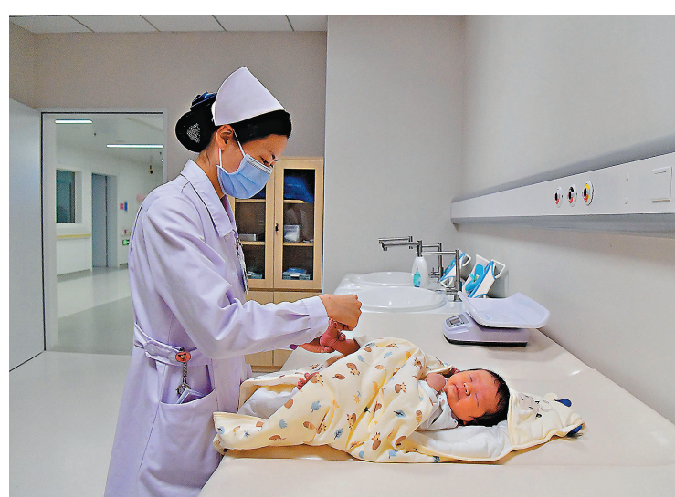
●專家表示，疫情從多方面影響了出生率。圖為醫院護士對新生嬰兒進行護理。