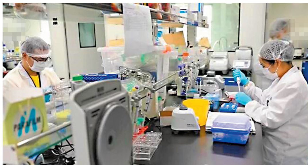
●北京大學謝曉亮團隊與丹序生物聯合開發的中和抗體藥物DXP-604臨床試驗效果良好。圖為科研人員在實驗室研製中和抗體類藥物。

中國工程院院士鍾南山20日在珠海舉行的第三屆中國老年健康國際論壇上表示，目前70歲至80歲老年人疫苗接種率較低，應該鼓勵更多老年人進行疫苗接種，有效做到早期預防。