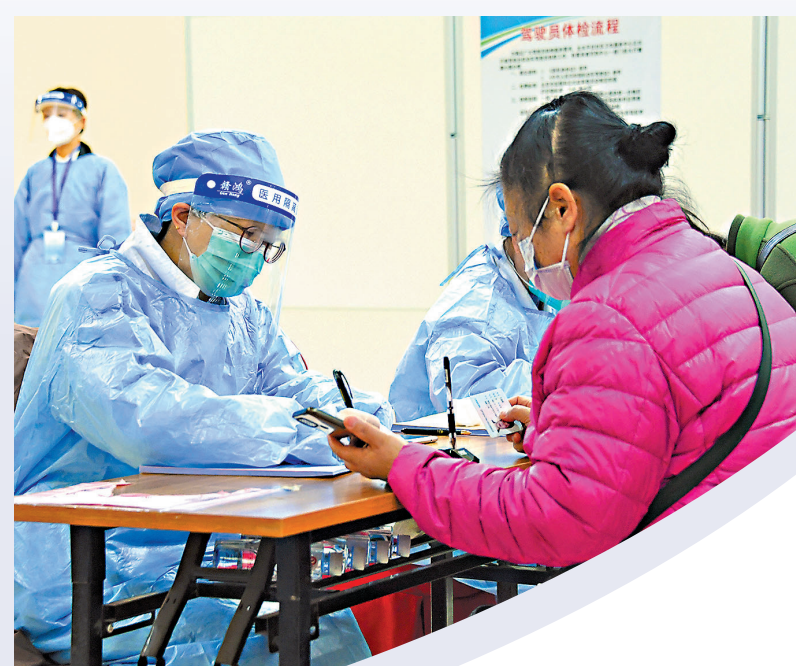
●內地10.76億人全程接種。圖為醫護人員（前左）在登記接種新冠疫苗加強針人員信息。