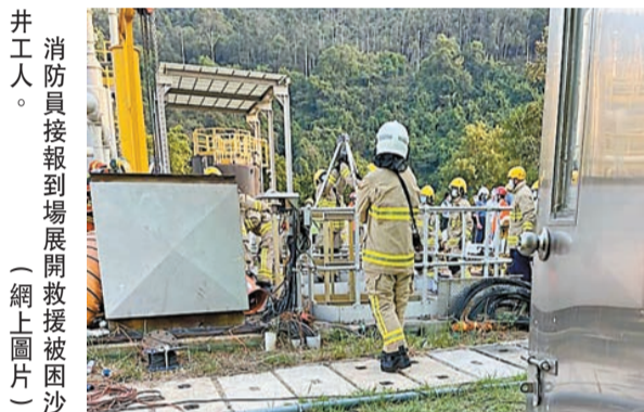
井工人。消防員接報到場展開救援被埋沙井工人。

【香港商報訊】記者周偉立報道：大嶼山小嶼灣污水處理廠發生1死3傷嚴重工業意外，昨日下午疑有工人失足跌落沙井內，壓傷井內3名正在換喉的工人。消防員接報到場把4名傷者救出送院搶救，至晚上其中1名女工傷重不治，其餘傷者分別1人情況危殆及2人情況嚴重。