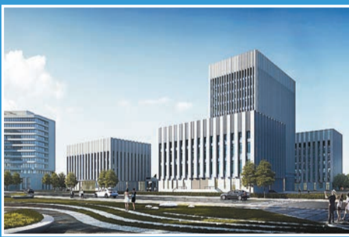
福州市疾病預防控制中心項目主體結構完成過半

本次「當先鋒爭一流」主題活動，長樂區緊緊圍繞全市現代化國際城市「建設六個城、五大國際品牌、九大專項行動」，以「四個大提升」「十大攻堅行動」為內容，共生成了372個項目。長樂區相關負責人表示，下一階段將以此活動為契機在以往工作基礎上，狠抓落實、攻堅克難，迅速掀起項目建設熱潮，努力為長樂經濟社會高質量發展超趕注注入更強勁的動力、蓄積更強大的潛能、做出更卓越的貢獻。