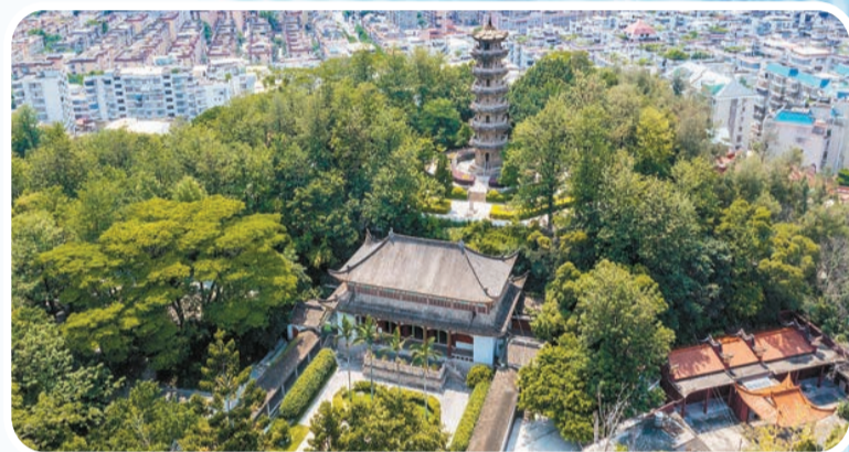
鄭和公園

2020年，恆申紡織、景豐科技等46項技改項目完成投資141億元，大東海實業、恆申集團、永樂控股上榜2020中國企業500強，金輪高纖等4家企業上榜2020中國民營企業500強，長源紡織等5家企業上榜2020中國製造業民營企業500強。據了解，長樂全區紡織工業總產值從1979年的72萬元增長到2001年的52.8億元，進而躍升到2020年超2200億元。