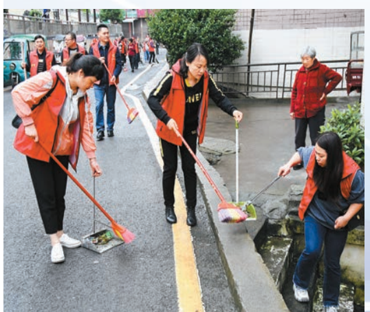
每星期五下午，新邵縣幹部都會身披「紅裝」上街開展志願服務活動。

今年4月，新邵縣成立由縣委書記任組長，其他縣委常委會議成員任副組長的「星期一夜校」領導小組，並設立專門辦公室。制定出台《新邵縣「星期一夜校」活動方案》，把每周一晚上定為幹部集中學習時間，每月不少於2次，每次不少於1.5小時。分層壓實責任，縣級層面主抓管理和服務，確保「星期一夜校」的全面覆蓋和縱深推進；各單位、各鄉鎮和村（社區）層面主抓推行和落實，確保「星期一夜校」的有序開展和有效學習；幹部層面主抓自律和自覺，確保「星期一夜校」的真實學學和成果轉化。全縣行政事業單位、村（社區）根據各自實際，制訂學習計劃，把政治理論、黨政法規、業務知識、中心工作學習作為重點學習內容。同時，把專家授課和領導幹部領學緊密結合起來，把從書本中學和用網絡來學緊密結合起來，把「院落會議」學和室內學緊密結合起來，做到「半月一集中學、半年一檢查、一年一評比」。