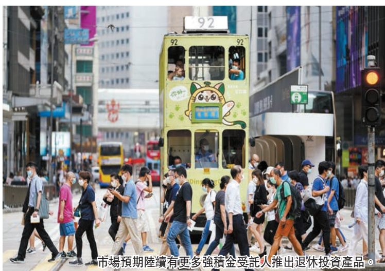
市場預期陸續有更多強積金受託人推出退休投資產品。