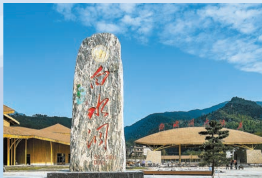
新邵縣白水洞國家級風景名勝區。