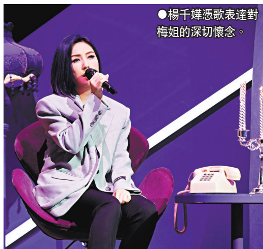
楊千嬅憑歌表達對梅姐的深切懷念。