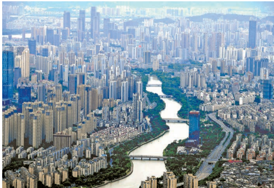
圖為俯瞰福州城區。

【香港商報訊】記者童越報導：國家統計局15日公布的10月70個大中城市商品住宅銷售價格變動情況顯示，10月份新建商品住宅價格指數、二手住宅銷售價格指數漲幅均為-0.3%，同比漲幅繼續收窄。專家表示，需求下行的態勢仍未改變，放鬆信貸僅限於小循環。另外，目前房價指數環比連跌兩個月值得關注，若從過去房地產市場的周期看，一般會下跌8個月。