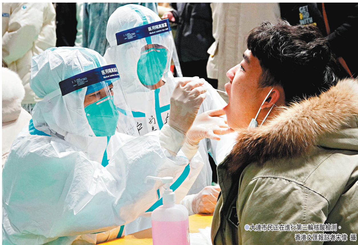
大連市民正在進行第三輪核酸檢測。

香港文匯報訊(記者宋偉 大連報道)13日零時至24時,遼寧大連新增本土病例60例,為本輪疫情單日新高。自4日該市報告本輪首例本土新冠肺炎確診病例,為大連莊河市首站定點冷庫員工。至今,10天的時間,大連已累計報告本土確診病例235例、本土無症狀感染者54例。這已是該市第三次爆發冷鏈相關本土疫情。大連市衛健委副主任趙連14日表示,本次疫情病毒載量高,傳播速度快,代際時間短,病情隱匿,不易發現,早期出現了較多的無症狀感染者,呈現單位聚集性、家庭聚集性和學校聚集性等特點,病例主要集中在科強食品公司、海闊食品公司和莊河大學城。截至到目前,大連已劃定2個高風險地區、31個中風險地區。