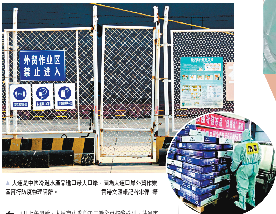
大連是中國冷鏈水產品進口最大口岸。圖為大連口岸外貿作業區實行防疫物理隔離。

自14日上午開始,大連市內啟動第三輪全員核酸檢測,莊河市正在進行第八輪核酸檢測。大連市衛健委副主任趙連表示,「國家和遼寧省緊急調集移動方艙和氣膜方艙等檢測力量和人員支持大連市,日檢測能力將達到46.8萬管。」