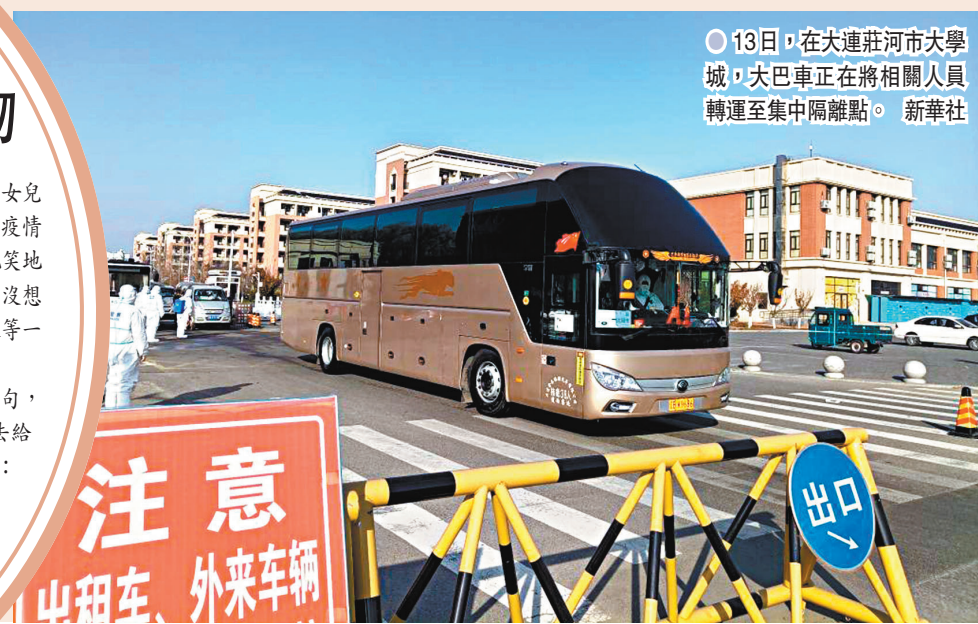
13日,在大連莊河大學城,大巴車正在將相關人員轉運至集中隔離點。

河南扶溝縣某學校安排心理教師與全校學生分享「放鬆減壓」手操。圖為學生在看心理教師的直播講解。