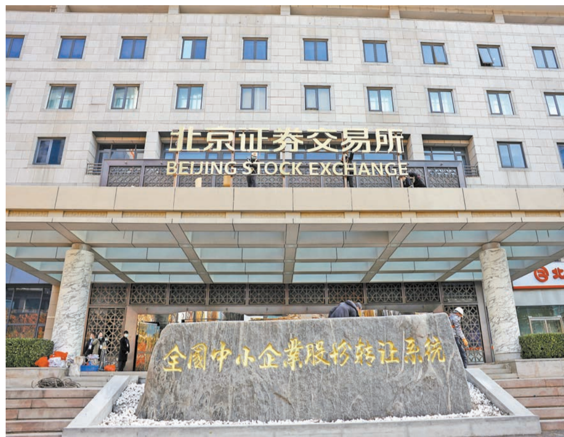
11月14日，施工人員在北京證券交易所辦公大樓進行門牌吊裝和焊接的工作。

14日上午9時，在北京金融街金陽大廈，北京證券交易所的辦公大樓完成了門頭的吊裝和焊接工作，與金融街1800多家金融機構樓宇風格類似，北交所的門牌也採用了燙金的大字，象徵着好的寓意。15日，北交所所有股票將在這裏正式開市交易。