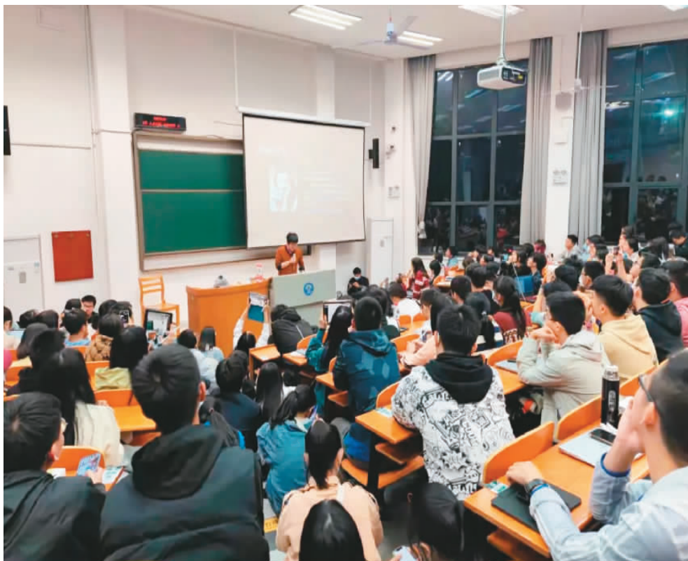
十月十七日，武汉大学一场名为《恋爱心理学》的讲座吸引了众多学生。