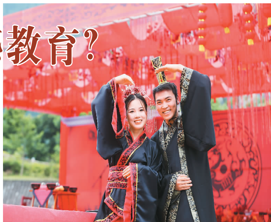
在今年六月举行的鲁渝青年婚恋交友活动中，一对新人在重庆市黔江区城市大峡谷景区合影。