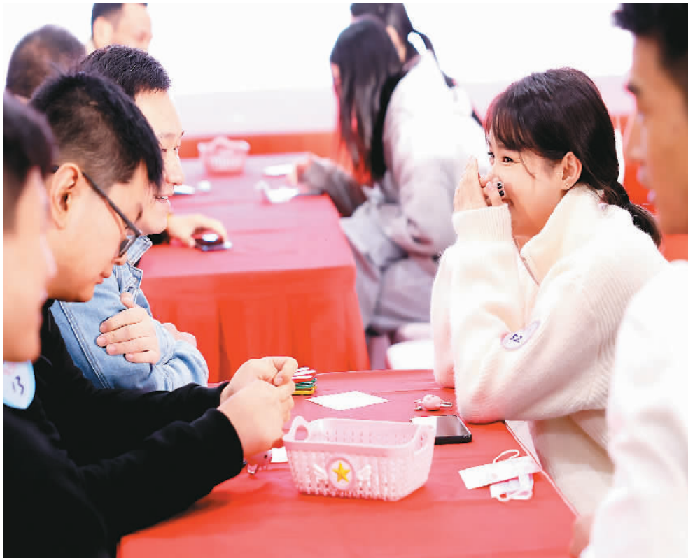
十月二十日，中国铁路上海局集团有限公司上海动车段百余名单身青年员工参加相亲活动。