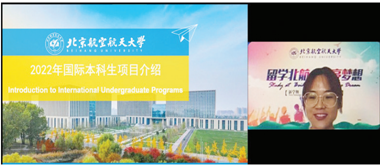
北京航空航天大学

【本报讯】2021年11月13-14日，为满足疫情期间印尼学生留学中国的需求，由教育部中外语言交流合作中心-汉考国际主办、印尼雅加达华文教育协调机构（简称“雅协”）承办、印尼巨港开心学校协办、中国银行（香港）雅加达分行支持的“印尼第四届 HSK 中国留学教育展”在线上顺利举行。来自中国的24所顶尖高校和1所与雅协、巴布亚省政府合作的双高职院校一起为印尼的3000多名中学生、大学生提供宝贵的留学信息。