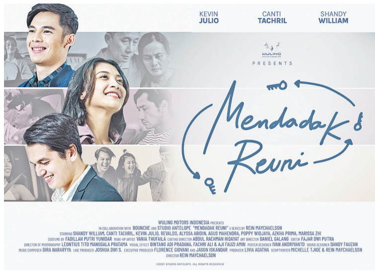
Wuling 推出电视网络喜剧“Mendadak Reuni”图片