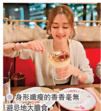
身形纖瘦的香香毫無避忌地大膽食。