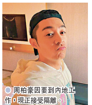
周柏豪因要到內地工作，現正接受隔離。