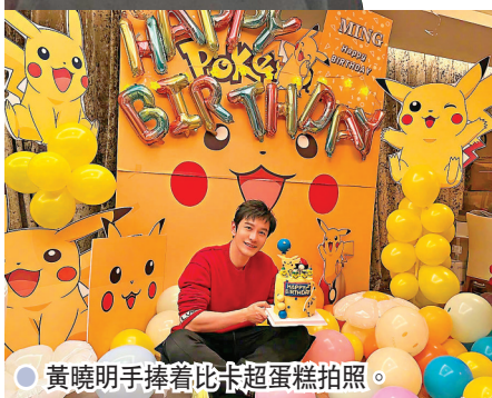
黃曉明手捧着比卡超蛋糕拍照。