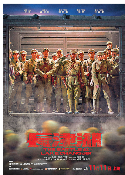
《長津湖》本月11日在港上映。