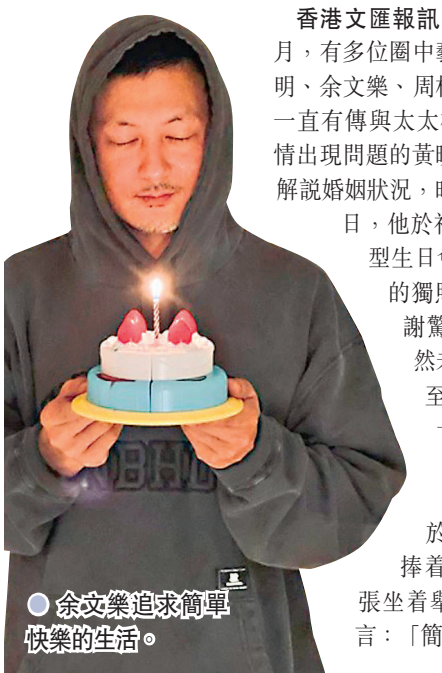
余文樂追求簡單快樂的生活。

香港文匯報訊(記者 阿祖)踏入11月，有多位圈中藝人生日，包括有黃曉明、余文樂、周柏豪和岑麗香等。之前一直有傳與太太楊穎(Angelababy)感情出現問題的黃曉明，當事人並沒加以解說婚姻狀況，昨日黃曉明踏入44歲生日，他於社交平台分享了舉行小型生日會，手捧着比卡超蛋糕的獨照，並簡單留言：「感謝驚喜，充電完畢！」依然未見太太Baby的踪影。至於一直跟太太王棠云十分恩愛的余文樂，同於昨天生日度過40歲，樂仔並沒放閃，只於社交平台上載了雙手捧着蛋糕閉目許願和另一張坐着舉起勝利手勢的照片留言：「簡單快樂就可以！」