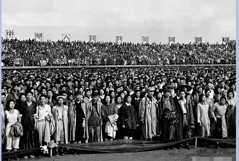
●錢嗣傑拍攝慶祝中國共產黨成立30周年大會。