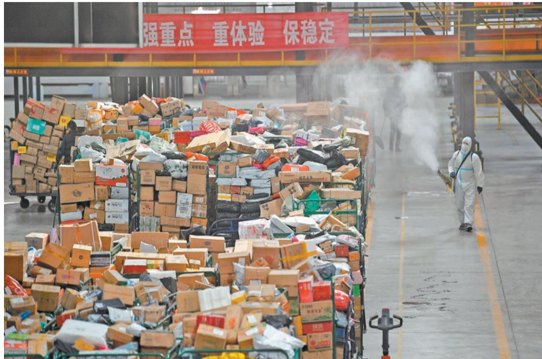
中國郵政集團公司工作人員在快遞分揀車間進行消毒作業。新華社

民航、鐵路、公路將加強遠端登機登車和進京檢查站查驗。環京地區通勤人員，在該措施執行後首次進（返）京須持48小時內核酸檢測陰性證明，此後每次