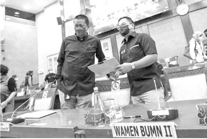
國企部第二副部長卡迪卡出席國會第二委員會的聽證會。

【本報訊】國企部第二副部長卡迪卡聲稱，眾所周知，今年11月9日(星期二)在國會談判重組鷹航(GIA)第六委員會的聽證會上，卡迪卡報告說，鷹航的資產達到69.3億美元或約99萬億盾，而債務與債務達到97.6億美元，或相當於140萬億盾。因此，淨資產為負數28億美元，相當於虧損40萬億盾。在總負債中，飛機租賃債務占主導地位，達到90億美元，相當於128萬億盾。我們目前正在與債權人談判。也許在二三個月內，我們可能會曉得他們的反應怎樣。