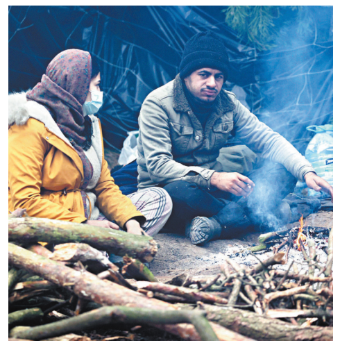
● 大批難民仍逗留當地。

克里姆林宮發言人佩斯科夫稱，俄羅斯試圖為解決白俄和波蘭邊境局勢作出努力，總統普京和盧卡申科11日通電話討論難民危機。 ● 綜合報導