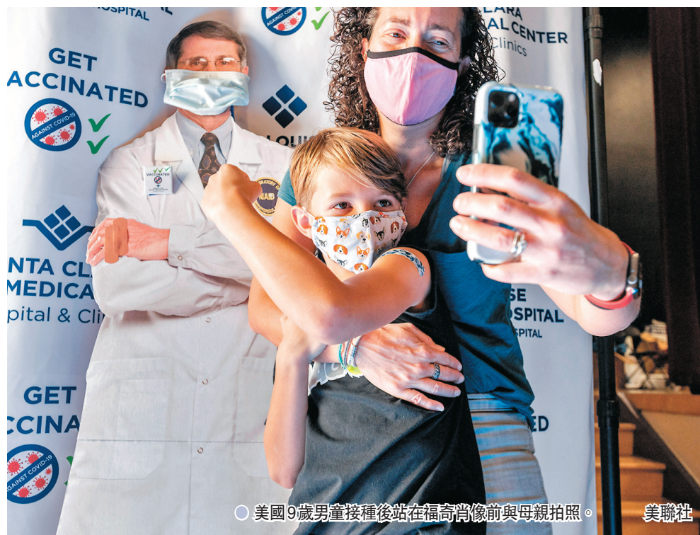
○ 美國9歲男童接種後站在福奇肖像前與母親拍照。

領導研究的斯沃德林指出，那些未有感染新冠的醫護，他們的T細胞之所以能迅速啟動免疫系統，可能與他們短時間之前曾暴露於其他冠狀病毒有關，這使他們免疫系統在新冠病毒開始複製