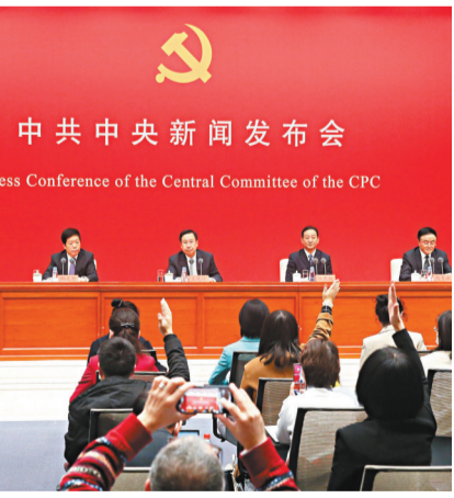
●中共中央在北京舉行新聞發布會，介紹黨的十九屆六中全會精神，並答記者問。

香港文匯報訊 綜合報道：中共中央12日就黨的十九屆六中全會精神舉行新聞發布會。中央政策研究室主任江金權指出，鄧小平曾深刻指出：「任何一個領導集體都要有一個核心，沒有核心的領導是靠不住的。」在一個有着9,500多萬黨員的大黨、有着56個民族和14億人口的大國，如果黨中央沒有核心，全黨沒有核心，那是不可想像的，是很容易搞散的，是什麼事情也辦不成的。黨中央有核心、全黨有核心，黨才有力量。 江金權表示，一個國家、一個政黨，領導核心至關重要。確立習近平同志黨中央的核心、全黨的核心地位，是時代呼喚、歷史選擇、民心所向。堅定擁護和維護習近平總書記的核心地位，全黨就有定盤星，全國人民就有主心骨，中華「復興」號巨輪就有掌舵者，面對驚濤駭浪我們就能够做到「任憑風浪起、穩坐釣魚船」。 江金權說，確立習近平同志黨中央的核心、全黨的核心地位，確立習近平新時代中國特色社會主義思想的指導地位，對新時代黨和國家事業發展、對推進中華民族偉大復興歷史進程具有決定性意義，這具有充分的實踐依據。有習近平新時代中國特色社會主義思想指引航向，兩個確立，符合全黨全軍全國人民的共同願望。同時，具有充分的理論依據，那就是：堅強的領導核心和科學的理論指導，是關乎黨和國家前途命運、黨和人民事業成敗的根本性問題。