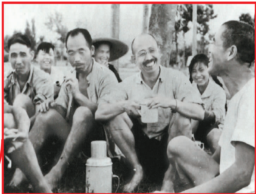
柳青（右三）在地头和农民聊天。

作家贾平凹说，他那时年轻，听人讲述柳青的故事，但无缘一见。我有幸见过柳青。作家陈忠实问我：“老阎，你见过几次柳青？”我说从1969年到他逝世前夕，总共六访柳青。陈忠实说：“我只见过他一次，还是他在我边上讲，我在下边听。”是的，我比他俩幸运，我熟悉柳青，但没有深刻了解柳青。现在再谈柳