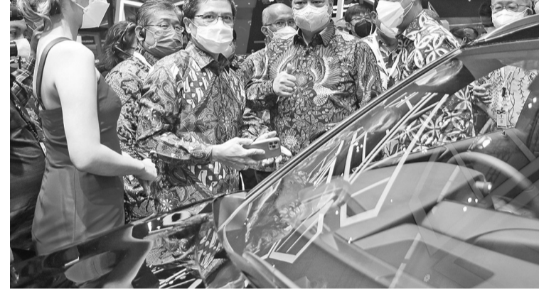
丹格朗2021年Gaikindo汽车展开幕 汽车制造业协会(GAIKINDO)从11月11日至21日在万丹省丹格朗瑟榜BSD会展中心举办了2021年Gaikindo印尼国际汽车展,共有24个Gaikindo成员的乘用车和商用车品牌参展,并在展会中推出了新型汽车和摩托车。

他说:“印尼民族需要来自年轻人成为当今的豪杰,主要是在第四次工业革命转型时代中,这不再是以肉体挡住的战争,而是在新的数字世界通过坚强的哲理、品德、批评、创意,打造成人工智能、加密货币、云端、及其它创意科技。”