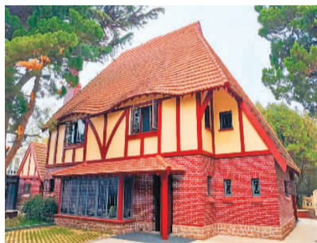
英国领事官邸旧址。