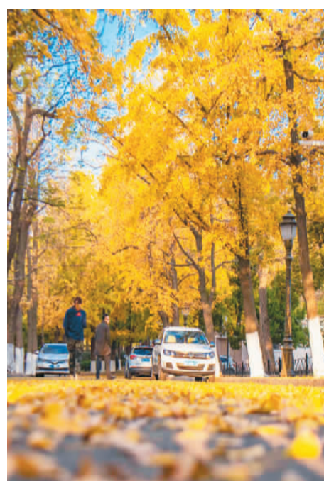
八大关秋景。