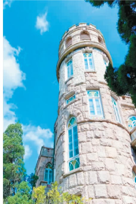
八大关花石楼。 资料图片