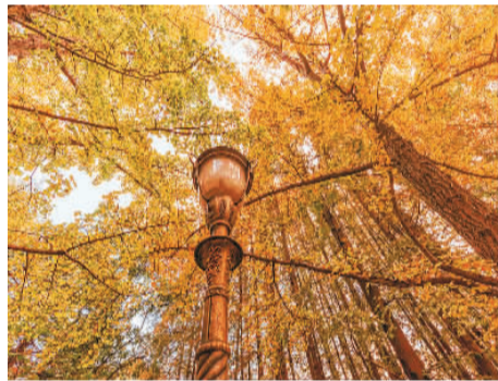
八大关秋景。