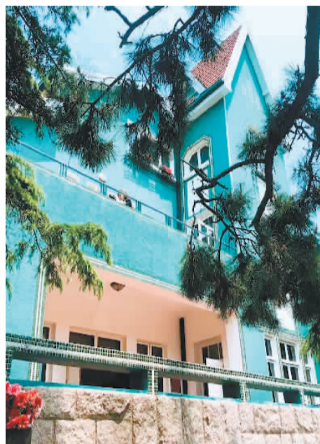
八大关公主楼。