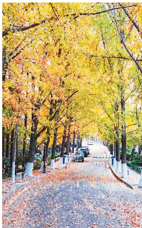
八大关画谷银杏大道。