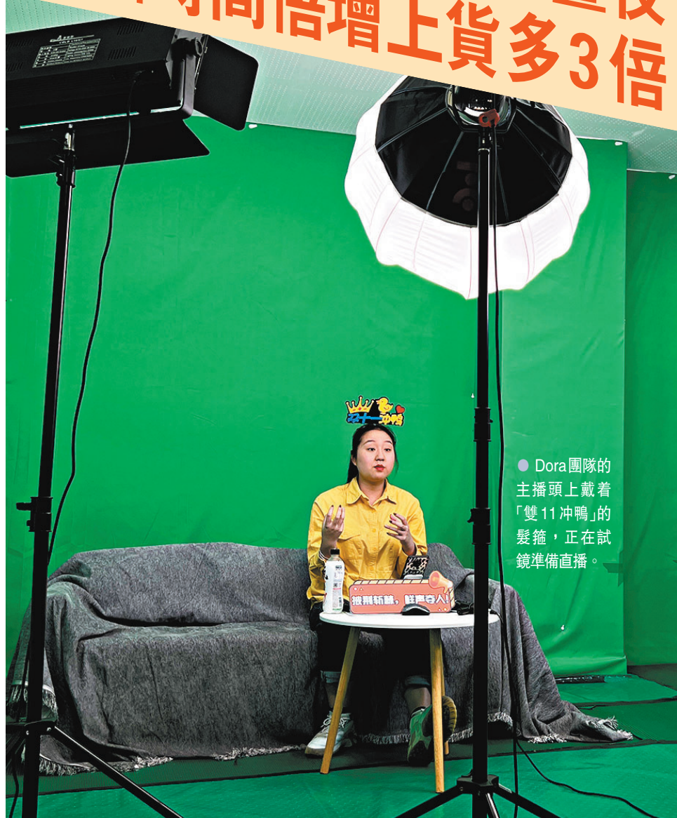
● Dora團隊的主播頭上戴着「雙11冲鴨」的髮箍，正在試鏡準備直播。