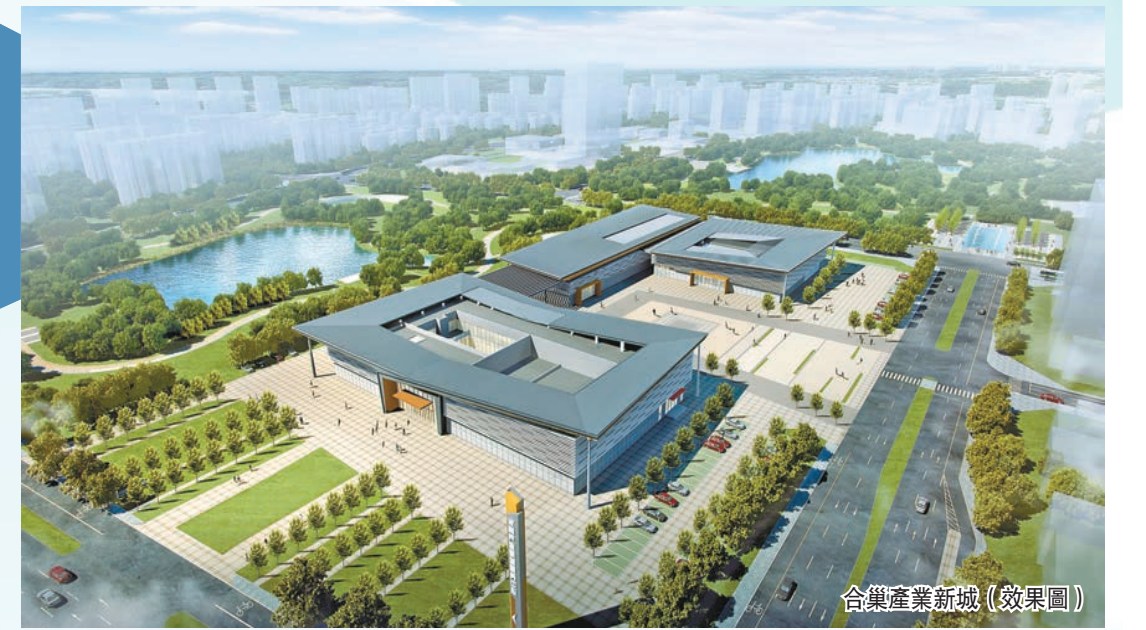
合巢產業新城（效果圖）

做優營商環境「軟實力」，堅持政策給力服務貼心，園區企業在轉型升級中煥發活力。全區新增規模以上工業企業36家，國家高新技術企業31家，國家級企業技術中心1個，國家級科技企業孵化器1家，國家科技型中小企業54家，省級「專精特新」企業10家，