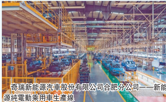
奇瑞新能源汽車股份有限公司合肥分公司——新能源純電動乘用車生產線

未來五年，安徽巢湖經開區將始終堅持以習近平新時代中國特色社會主義思想為指導，深入學習貫徹習近平總書記「七一」重要講話精神和考察安徽重要講話指示精神，在新的趕考路上，認真貫徹合肥市第十二次黨代會精神，全面啓動與高新區合作聯動，加快探索合作共建與轉型發展新路徑。力爭「十四五」期間全區主要經濟指標增進速度居合肥市前列，綜合實力穩居全省省級以上開發區第一方陣，到2025年實現地區生產總值達到200億元，規上工業總產值達300億元，固定資產投資達500億元，財政收入達20億元，規上企業數量達100家。