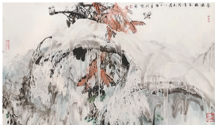
于志学《春风摇玉雪松》。

本报电（记者邹雅婷）由中国国家博物馆、中国美术家协会、天津美术学院主办的“知行墨境——当代中国画家邀请展”近日在国博开幕。展览遴选38位画家近百件作品，较为全面地展示当代中国画家创作成果，表现了艺术家深入挖掘中华优秀传统文化资源、研究中国画语言风格与时代特色的艺术实践历程。