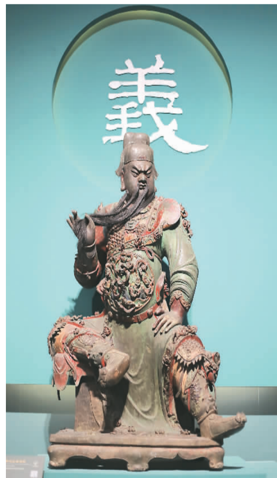
明彩绘关公铜坐像。

为配合此次展览，山西博物院还将推出精彩纷呈的公众教育活动及文创产品。据悉，展览将持续至2022年2月27日。