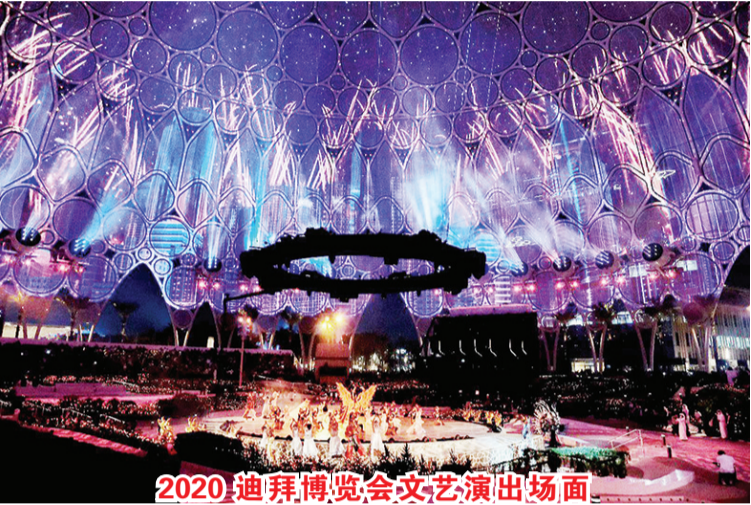
2020迪拜博览会文艺演出场面