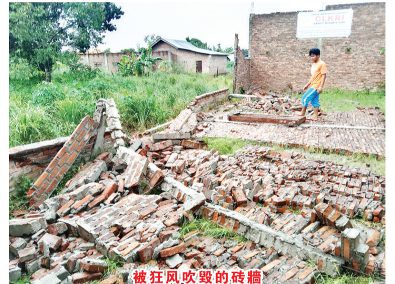
被狂风吹毁的砖牆