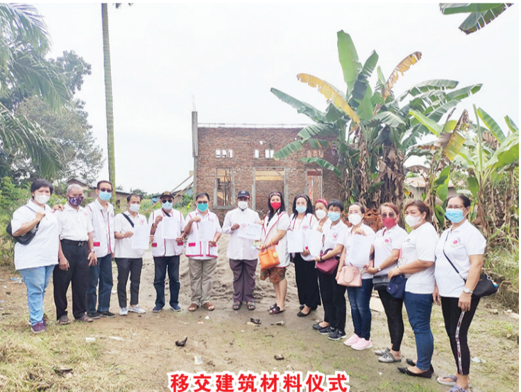
移交建筑材料仪式