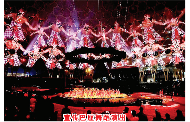
宣传巴厘舞蹈演出