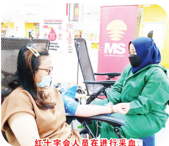
红十字会人员在进行采血