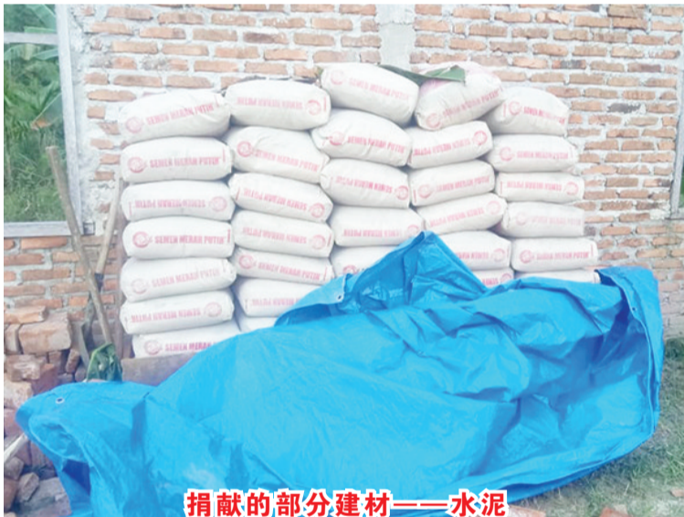
捐献的部分建材——水泥