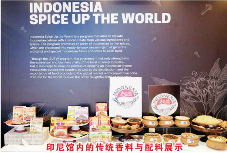
印尼馆内的传统香料与配料展示