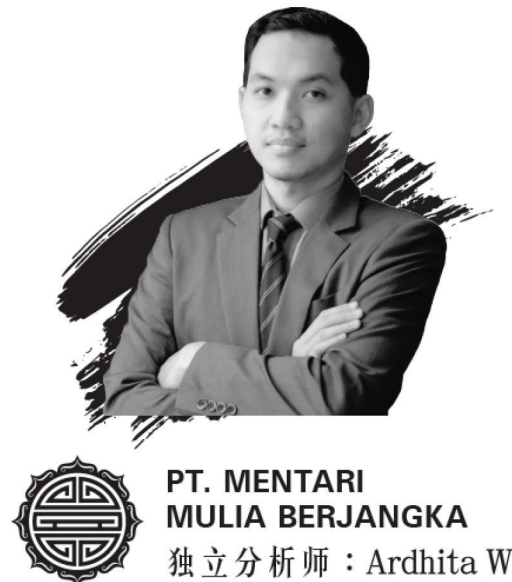
PT. MENTARI MULIA BERJANGKA 独立分析师: Ardhita W