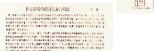
▲1951年9月15日的《人民日报》刊登歌曲《歌唱祖国》及相关文章

“五星红旗迎风飘扬，胜利歌声多么响亮……”对许多中国人来说，《歌唱祖国》几乎伴随着人生的成长过程。记忆中，几乎祖国的每个重要时刻都有这首歌曲相伴，以至于回想起这些重要时刻，很多人脑海中就会回响起这首歌曲的旋律。作为一首具有时代烙印的群众歌曲，是什么赋予《歌唱祖国》如此长久的生命力？又何以激励一代又一代中华儿女完成不同阶段的历史使命？