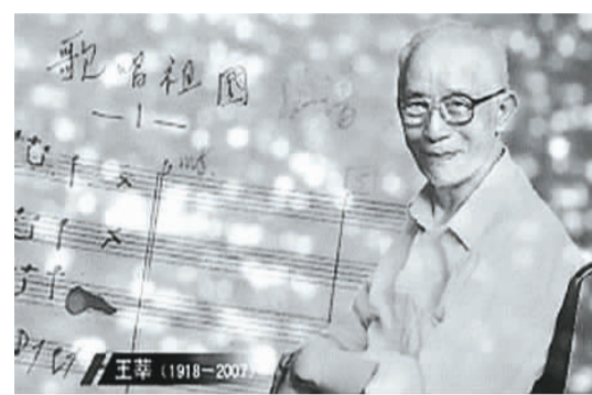
▲《歌唱祖国》词曲作者王莘 资料图片