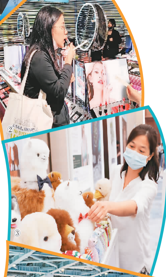
图②：在消费品展区雅诗兰黛展台，观众正在体验美妆产品。