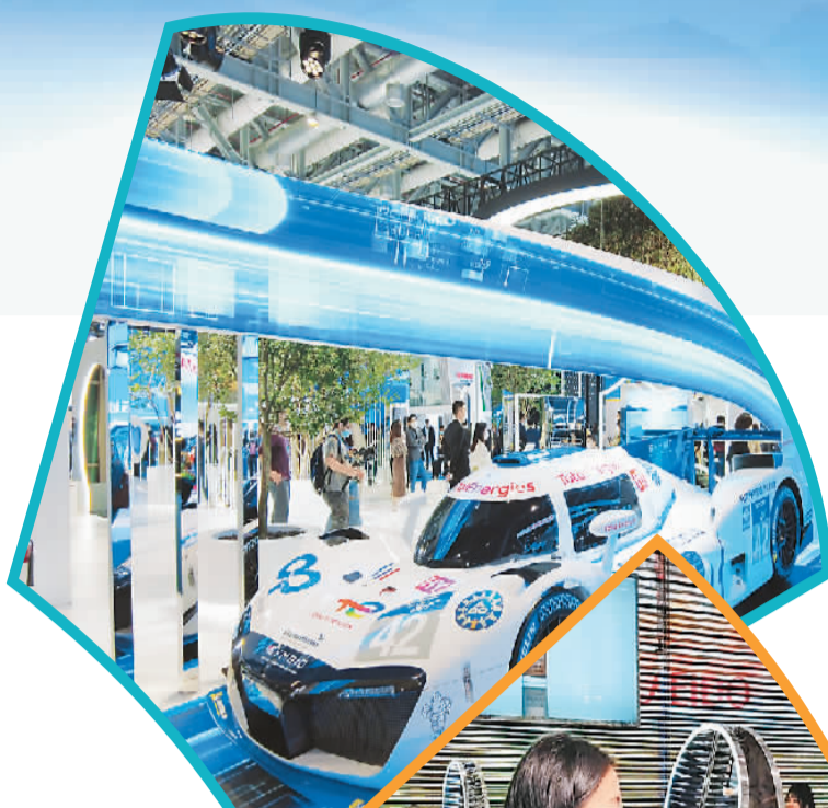
图①：在汽车展区，法国米其林首次在亚洲展示Mission H24氢能源赛车。

是什么吸引这些国家参加本届进博会？孙成海表示，前三届进博会体现出的“四大平台”作用和参会各国取得的丰硕成果，是吸引这些国家今年参加进博会的主要原因。“另外，进博会为构建人类命运共同体搭建了平台，发达国家、发展中国家、‘一带一路’沿线国家和最不发达国家通过参加进博会都取得了良好成效，都深切体会到进博会平台带来的开放市场的吸引力。”孙成海说，“我相信，他们也会积极参与以后的进博会。”