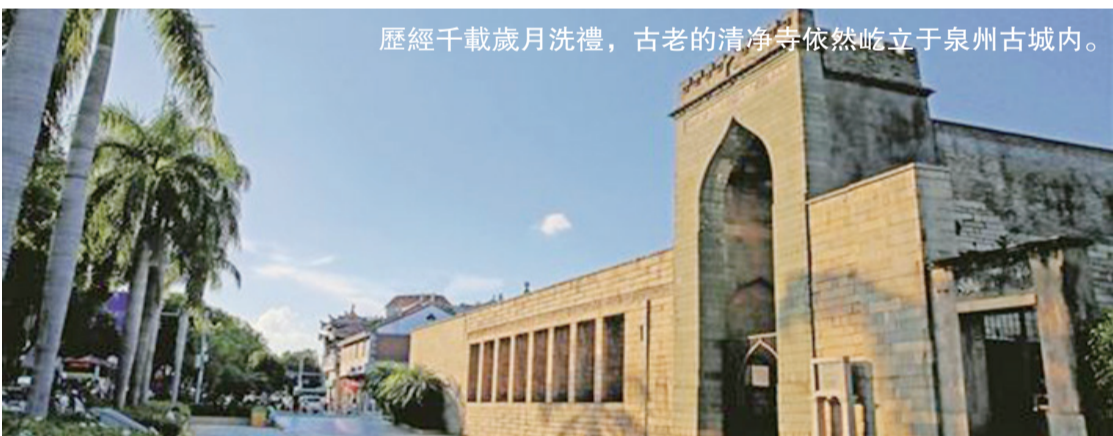
歷經千載歲月洗禮，古老的清淨寺依然屹立于泉州古城內。