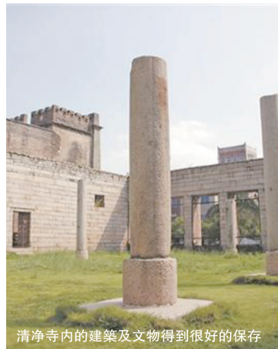
清淨寺內的建築及文物得到很好的保存

泉州素有“世界宗教博物館”的美譽，是聯合國教科文組織確定的全球第一個“世界多元文化展示中心”，位於泉州古城中心的塗門街，便是這些榮譽的一個生動的展示窗。這條街從西往東，短短數百米內，分別坐落着代表儒家文化的府文廟、代表伊斯蘭文化的清淨寺和民間信仰的重要代表關帝廟，千年以來，這些宗教信仰在此毗鄰而居、和諧共處，共同構成了泉州獨特多元的燦爛文化。其中，清淨寺作為“泉州：宋元中國的世界海洋商貿中心”的代表性遺產要素之一，因為泉州成功申遺，再次吸引了世界的目光。