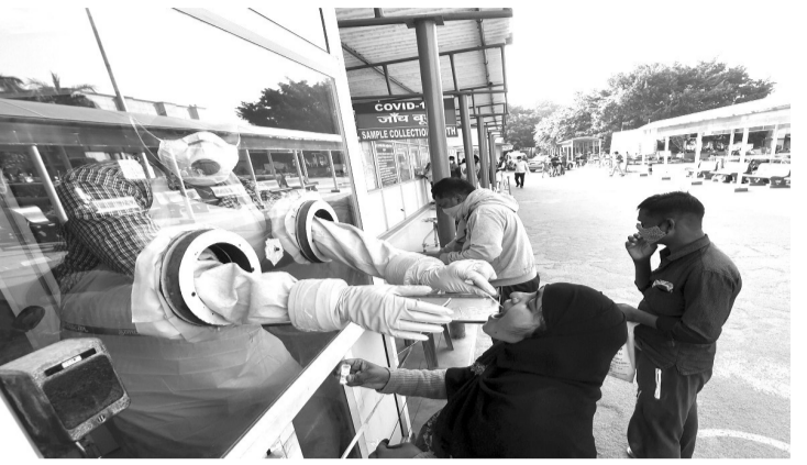
炎不仅在国内外,而且是全球性的。RT-PCR检测的需要,是由我国标本检测的增加推动的,我国的阳性率目前低于世卫组织标准的0.4%。越早发现阳性病例,就越早与健康人分离。当然,这可以防止新冠肺炎病毒在民众中的传播。(亮剑)

炎大流行初期,库存面罩和防护工具的稀缺性,这也影响了当时的价格。然而,随着口罩和防护工具制造商数量的增加,情况逐渐改善。同样的,RT-PCR拭子试剂,在国内只有不到30家制造商。但目前有200多种RT-PCR拭子试剂进入外国,并以不同的价格获得卫生部的营销许可证。这意味着RT-PCR拭子试剂组件的变异和价格一直存在竞争。众所周知,RT-PCR拭子在诊断阳性病例时仍然是标准的。新冠肺