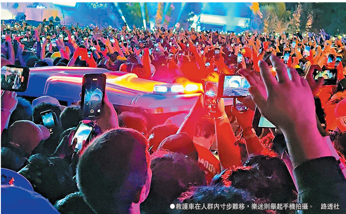
●救護車在人群內寸步難移，樂迷則舉起手機拍攝。