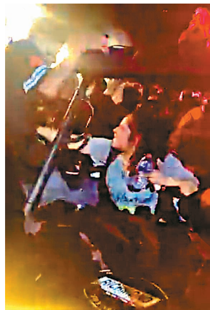
●小型救護車上的人與樂迷衝撞。

休斯敦警察局副局長薩特懷特表示，事態在短短數分鐘內升級，警方在9時38分決定將事件定性為「大型傷亡事故」。