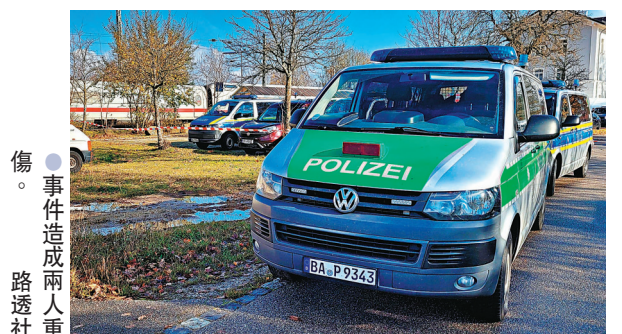
●事件造成兩人重傷。

德國一列高速列車6日發生持刀襲擊案，造成至少3人受傷，疑犯當場被捕。德國《圖片報》報道，疑犯現年27歲，是阿拉伯裔，懷疑有精神問題，調查人員暫時排除事件與恐怖主義有關。事發列車原訂從雷根斯堡駛往紐堡，一名男子在駛至索伊伯斯多夫站時揮刀襲擊其他人，造成3人受傷，其中兩人重傷。警方接報到場拘捕疑犯，目前未有證據顯示有其他同謀在逃。索伊伯斯多夫站事後關閉，約200名乘客亦離開列車，並前往一間餐廳等候安排。德國近年面臨伊斯蘭極端主義者和極右組織的恐襲威脅，自2015年起已發生多宗襲擊，在今年6月25日，一名索馬里裔男子在南部符茲堡持刀襲擊，造成3死和5傷。 ●綜合報道