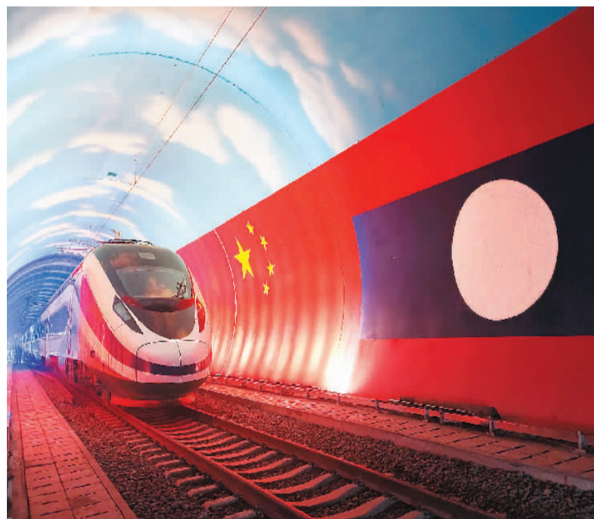
▲“澜沧号”动车组10月16日运抵刚刚建成的中老铁路万象站,正式交付老中铁路有限公司。图为10月15日,“澜沧号”动车组通过中老友谊隧道内的两国边界。

近日,随着中老铁路全线铺轨完成,中老铁路进入通车前建设冲刺阶段。“以前无法想象,现在美梦成真。”“我已经按捺不住要登上火车的心情了。”……老挝网上社区的热烈评论,透露出老挝民众对铁路通车的期盼。 这条千余公里的钢铁巨龙,从昆明出发,穿越磨盘山、哀牢山、无量山,跨过元江、阿墨江、把边江、澜沧江,经过中老铁路友谊隧道进入老挝,最终抵达万象。通车运营后,这条友谊、科技、绿色、开放的铁路必将承载着中老两国人民的梦想,穿山越岭,创造辉煌。