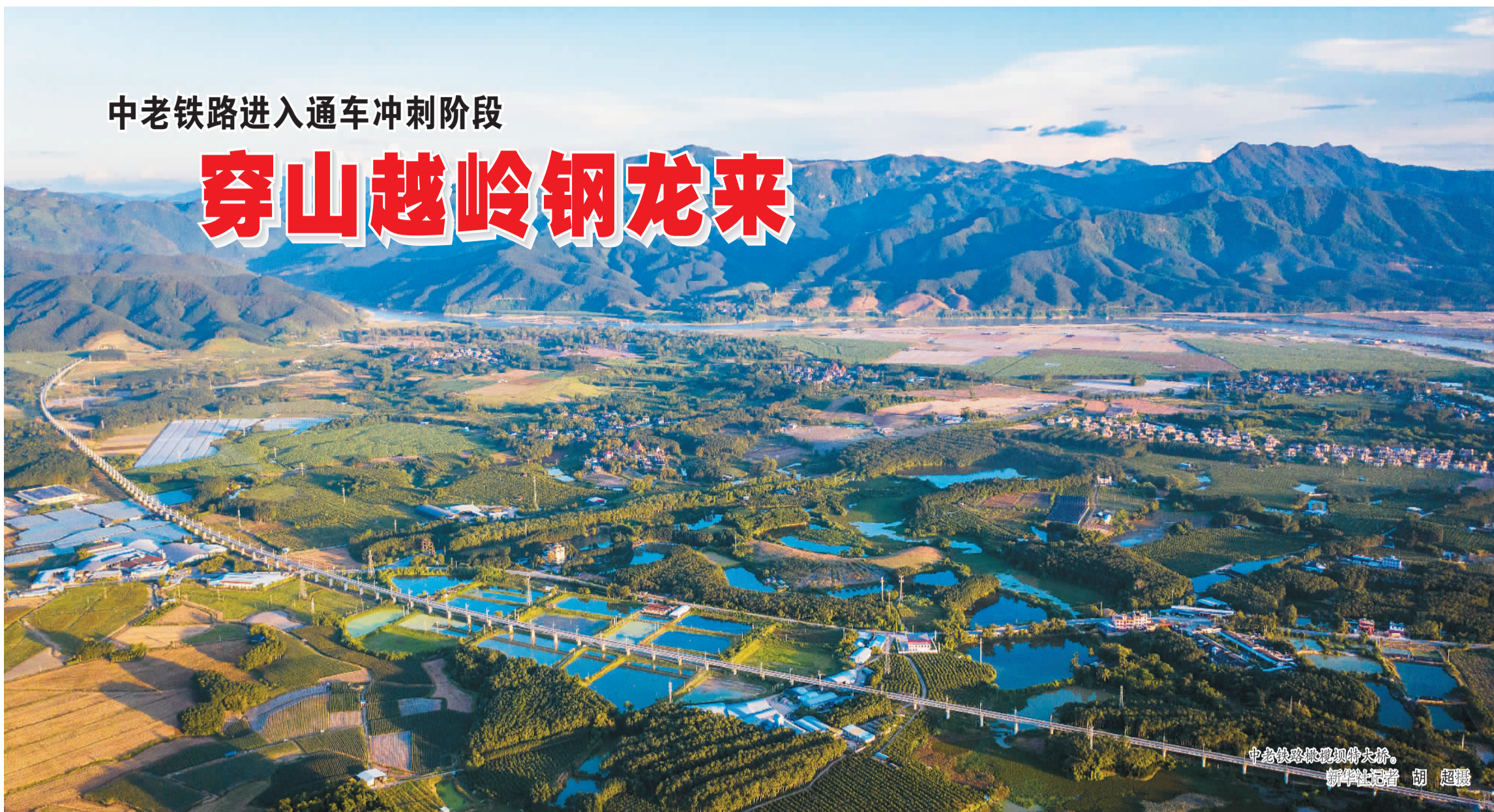
中老铁路老挝跨境大桥。