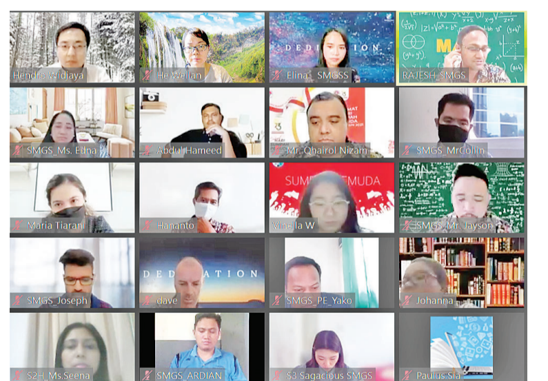
中学老师们齐聚云端