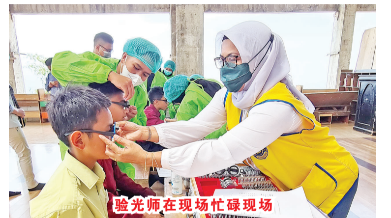
验光师在现场忙碌现场