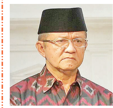
印尼伊斯兰学者理事会副主席安瓦尔

【本报讯】此前,印尼伊斯兰学者理事会(MUI)副主席安瓦尔(Anwar Abbas)表示,他希望警察 88