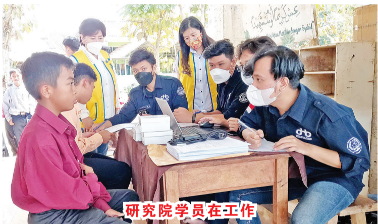
研究院学员在工作

丧失视力、怎样爱护、防护,使我们能拥有健康的眼睛。国际防盲机构还给了一个名为‘20-20-20 法则’是一个良好而有效的模式,可以帮助你眼睛免受长时间凝视屏幕的劳累。每花 20 分钟使用屏幕,你应该试着看一下离你 20 英尺远的东西,时间为 20 秒。” 雪妮报道