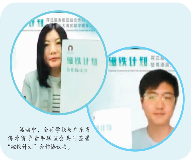
活动中，全荷学联与广东省海外留学青年联谊会共同签署“磁铁计划”合作协议书。

据了解，“磁铁计划”荷兰服务枢纽站今后将定期向在荷中国留学生发布粤港澳大湾区创新创业、人才服务等政策举措，对接相关项目落地实施，并为在荷留学人员回国工作提供建议，助力粤港澳大湾区招才引智。