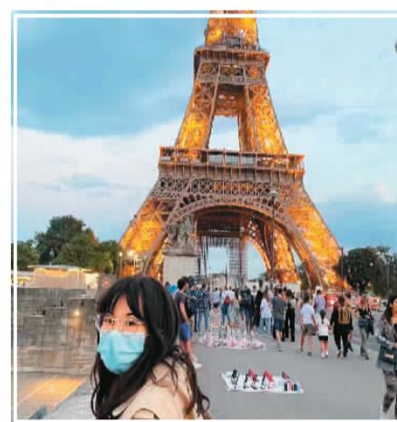
作者于法国留学近照

初来乍到之时，我缩手缩脚地接触新环境，时刻保持着谨慎，我观察并模仿着人们的言行，希望能更快适应这里全新而陌生的环境。