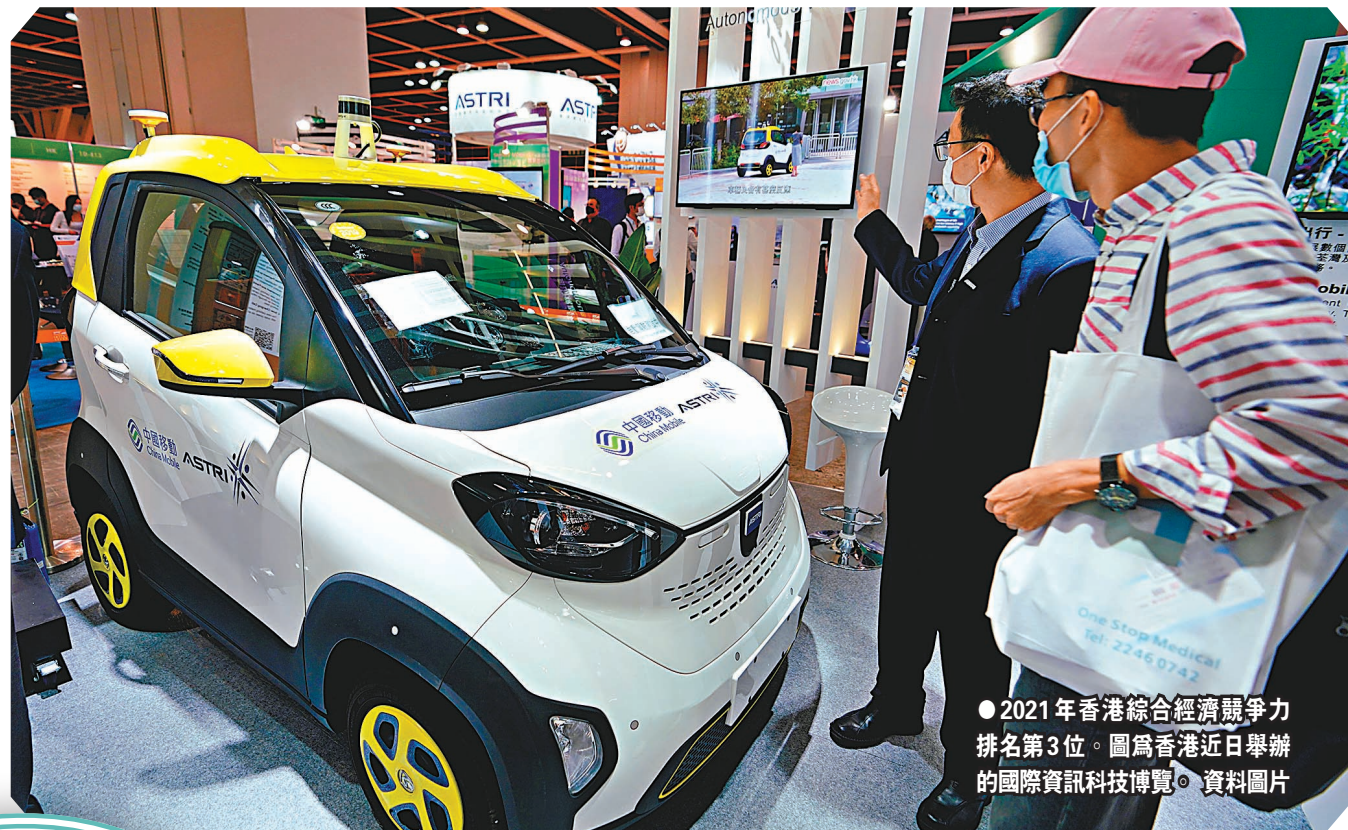
●2021年香港綜合經濟競爭力排名第3位。圖為香港近日舉辦的國際資訊科技博覽會。