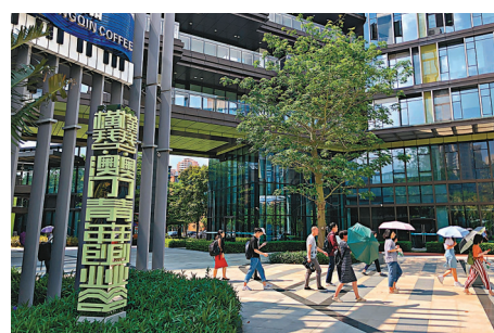
●橫琴澳門青年創業谷。

報告稱,粵港澳大灣區包括港澳和珠三角9市。其中四個中心城市,三個進入全國五強:深圳綜合經濟競爭力排名第2,香港第3,廣州第5,澳門名次最低,排名第15位。而節點城市中,佛山(排名第14位)亦超越澳門,另一節點城市東莞(排名第17)緊逼澳門。與此同時,大灣區內發展也並不均衡,另有珠海(排名第23)、中山(排名第38)進入了全國五十強,另外三個,惠州排名第56,江門第78,而肇慶則跌出百強,為第130名。