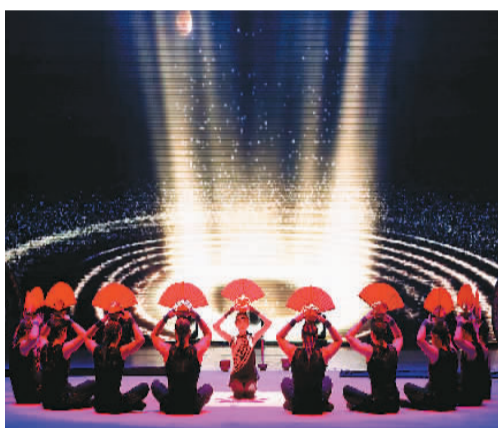
▲ 杂技《腾·韵——顶碗》

在这样的理念下，中国杂技团推出了众多独到的节目，在国际市场上非常抢手。一些节目甚至是全世界独一无二的，至今无人复制。例如在第二十八届摩纳哥蒙特卡洛国际马戏节上摘得“金小丑”奖的《腾·韵——顶碗》。顶碗原本是中国杂技的传统项目，历经数代演员打磨，由单人项目变为集体项目，直至发展