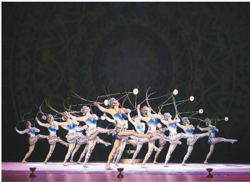
▲ 杂技《俏花旦——集体空竹》

杂技在中国对外文化交流活动中一直扮演重要角色。中国杂技以“新、奇、美”等特点，收获众多国际奖项，深受海外观众青睐。日前，记者来到中国杂技团，走近那些精彩绝伦、享誉国际的杂技节目。