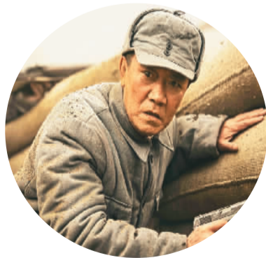
▲ 《生死阻击》剧照

近日，由北京市广播电视局指导、北京广播电视台视听发展基金扶持的电影《生死阻击》在爱奇艺网站独家上线。