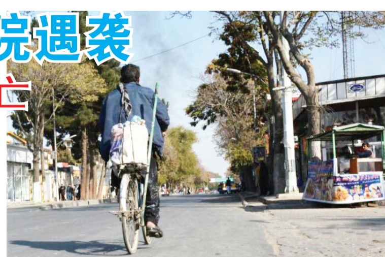
当地时间11月2日,阿富汗首都喀布尔最大的军事医院发生爆炸,这是近一个月的第三起伤亡惨重的恐袭事件。法新社称,极端组织“伊斯兰国呼罗珊”已宣称对此次爆炸负责。图为阿富汗民众骑车出行,远处爆炸现场烟雾升腾。

11月1日,埃塞政府发言人莱盖塞·图卢说,“提格雷人民解放阵线”(“提人阵”)武装日前在该国北部阿姆哈拉州杀死100多名平民。据当地媒体报道,“提人阵”武装声称已占领邻近提格雷州的阿姆哈拉州重镇德塞和孔博勒查,该地区距离首都亚的斯亚贝巴约380公里。