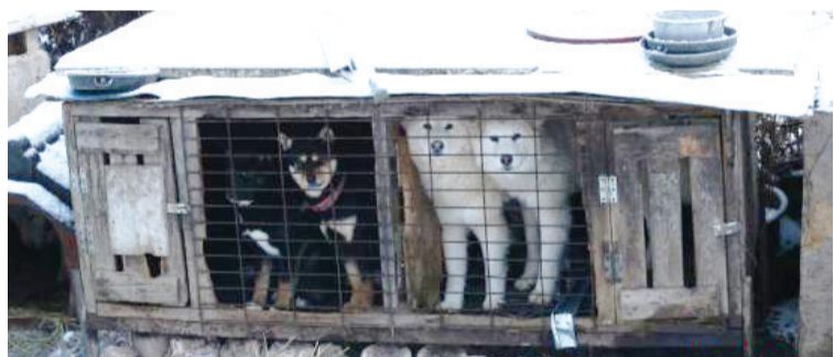
资料图:韩国始兴市一处狗肉农场。

中新网11月3日电 据韩媒报道,韩国民调机构Realmeter3日发布的一项调查结果显示,近五成韩国民众反对政府立法禁食狗肉。