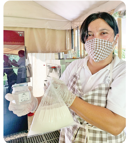
展示椰子油从椰奶中自然分离