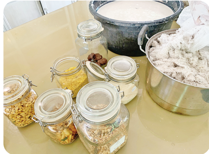
椰肉制成的各种健康零食