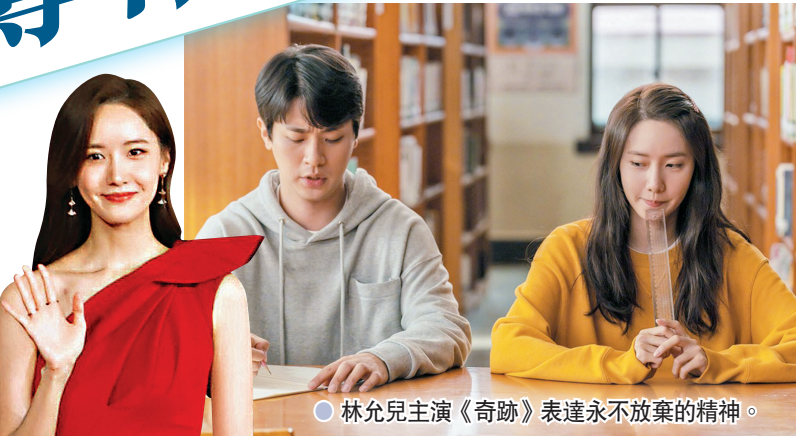
● 林允兒主演《奇跡》表達永不放棄的精神。