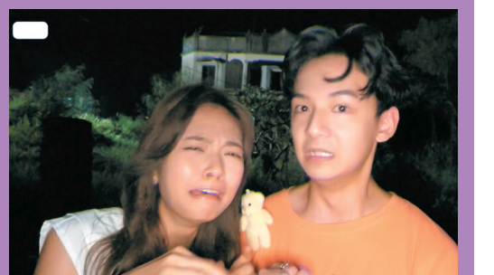
● 夜探鬼屋情節,既驚險又搞笑。