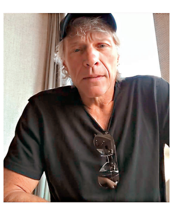
● Jon Bon Jovi染疫後活動被迫取消。

而稍早前,英國創作型歌手Ed Sheeran同樣證實染疫,可見大家對疫情仍不能掉以輕心。