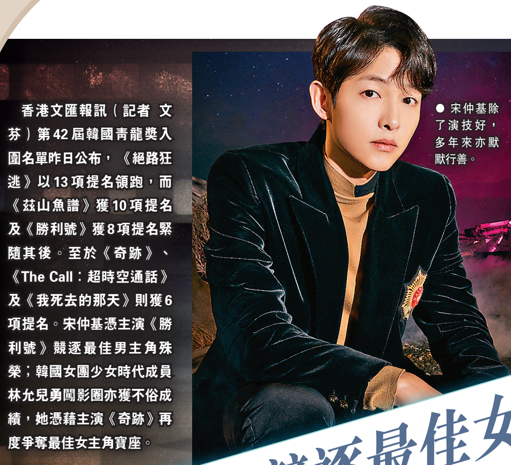
● 宋仲基除了演技好，多年來亦默默行善。