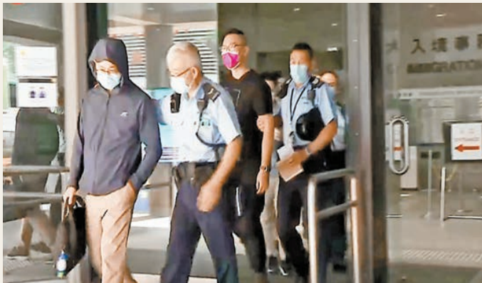
灣仔入境事務大樓5名職員涉使用仿冒「安心出行」應用程式被捕。

【香港商報訊】記者區天海報道：昨起，市民進入大部分政府處所必須使用「安心出行」應用程式，包括政府大樓、立法會、法院、康文署轄下場地等。而在實施有關措施首日，灣仔入境事務大樓就有包括入境處職員共5人涉使用仿冒「安心出行」應用程式被捕。